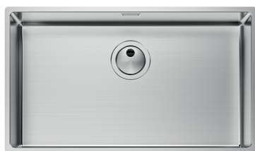
Lavello S4001 3138 850