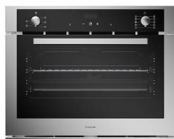
Forno KE 75 7137 000