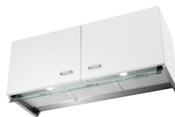
Cappa d'aspirazione New Wing 2512 072